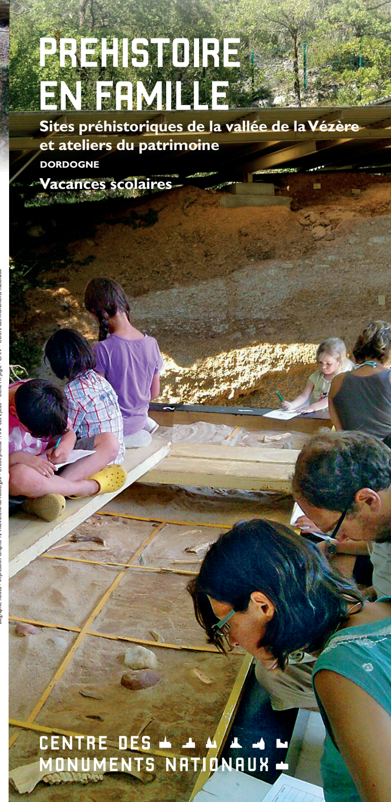
Biographie Rodaz - Impression Grapho 12 Villefranche-de-Rouergue