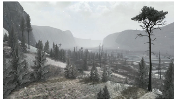
Image extraite de l'installation immersive The Cave © Balthazar Auxietre - 2016