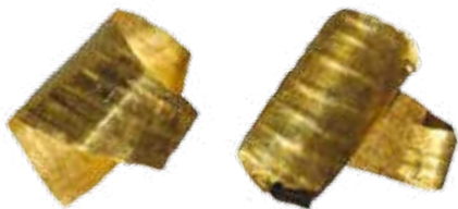
Ornements en or du tumulus des Sables, à Saint-Laurent-Médoc (Gironde)

Exposition ensuite présentée au musée des Confluences à Lyon du 1 er décembre 2015 au 17 avril 2016.